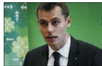
ØNSKER MAKS OLJE: Oljeminister Ola Borten Moe.

Hvorfor i all verden er det slik? Alle som vil, må jo se at oljeboomen er skadelig for både miljøet, sikkerheten og økonomien. En mulig forklaring på det uforklarlige er Statoils svært sterke dominans i norsk politikk og næringsliv. Selskapet er ti ganger større enn det nest største på Oslo børs, og oljepumpene bidrar årlig med 300 milliarder kroner til det norske statsbudsjettet. Slikt gir naturligvis makt.