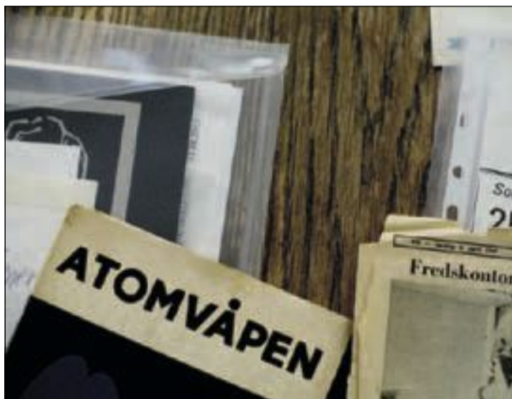
ATOMVÅPEN: Sovjetunionen gjennomførte sin største kjernefysiske prøvesprengning i 1961. Det ble startskuddet for Fredskontoret.